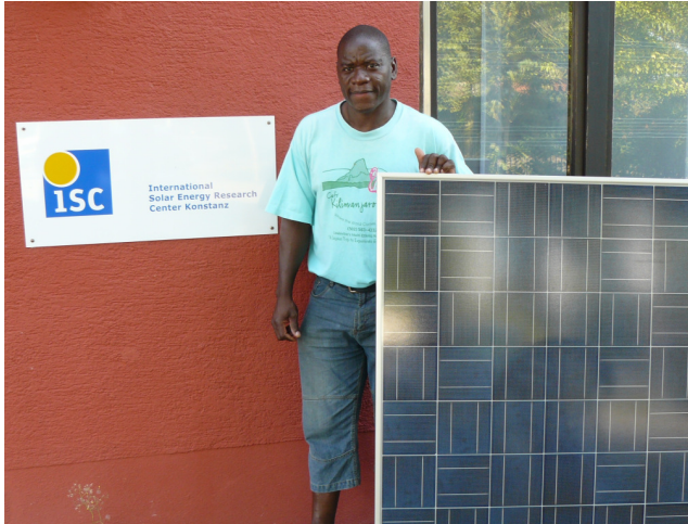
Module werden angeliefert / Modules are delivered