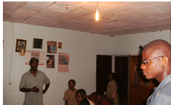
Energiesparlampen spenden Licht im Inneren / Energy-saving lamps lighten up the rooms