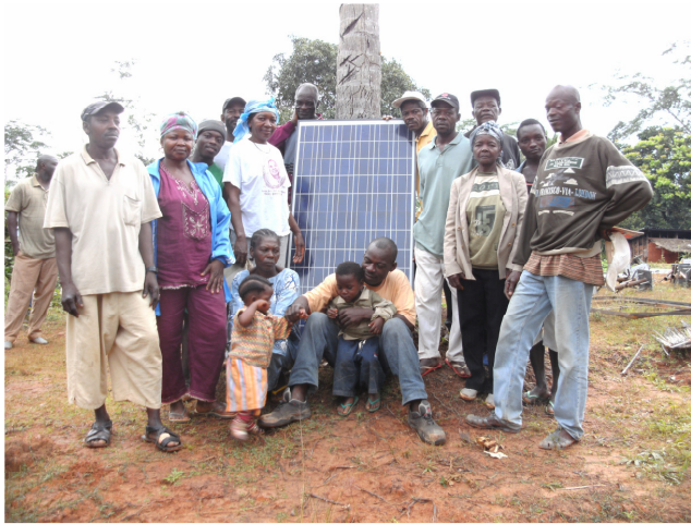
Module sind im Dorf angekommen / Modules arrived at the village