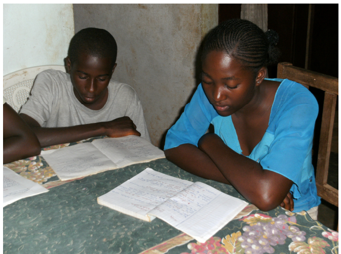
Kinder können jetzt Abends lesen und lernen / Children can do their homework and read in the evening