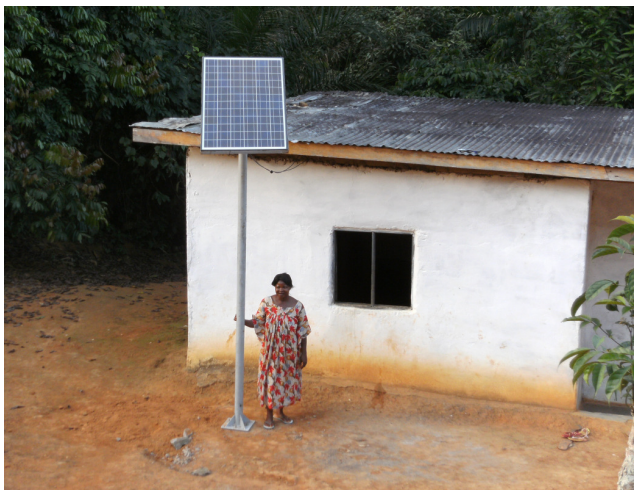
Beispiel eines freistehenden Moduls / Example of a free-standing module