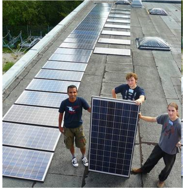
Module werden am ISC Konstanz getestet / Modules are tested at ISC Konstanz