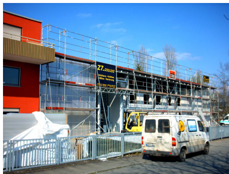
Hallensüdfassade - southern façade of the hall