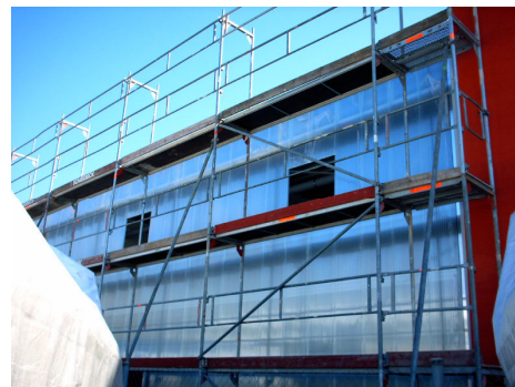
Hallennordfassade - northern façade of the hall