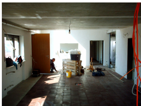
Neuer Eingangsbereich – the new entrance area