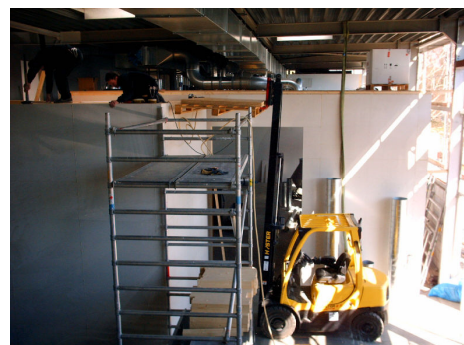
Die fertige Reinraumbox – the finished clean room box